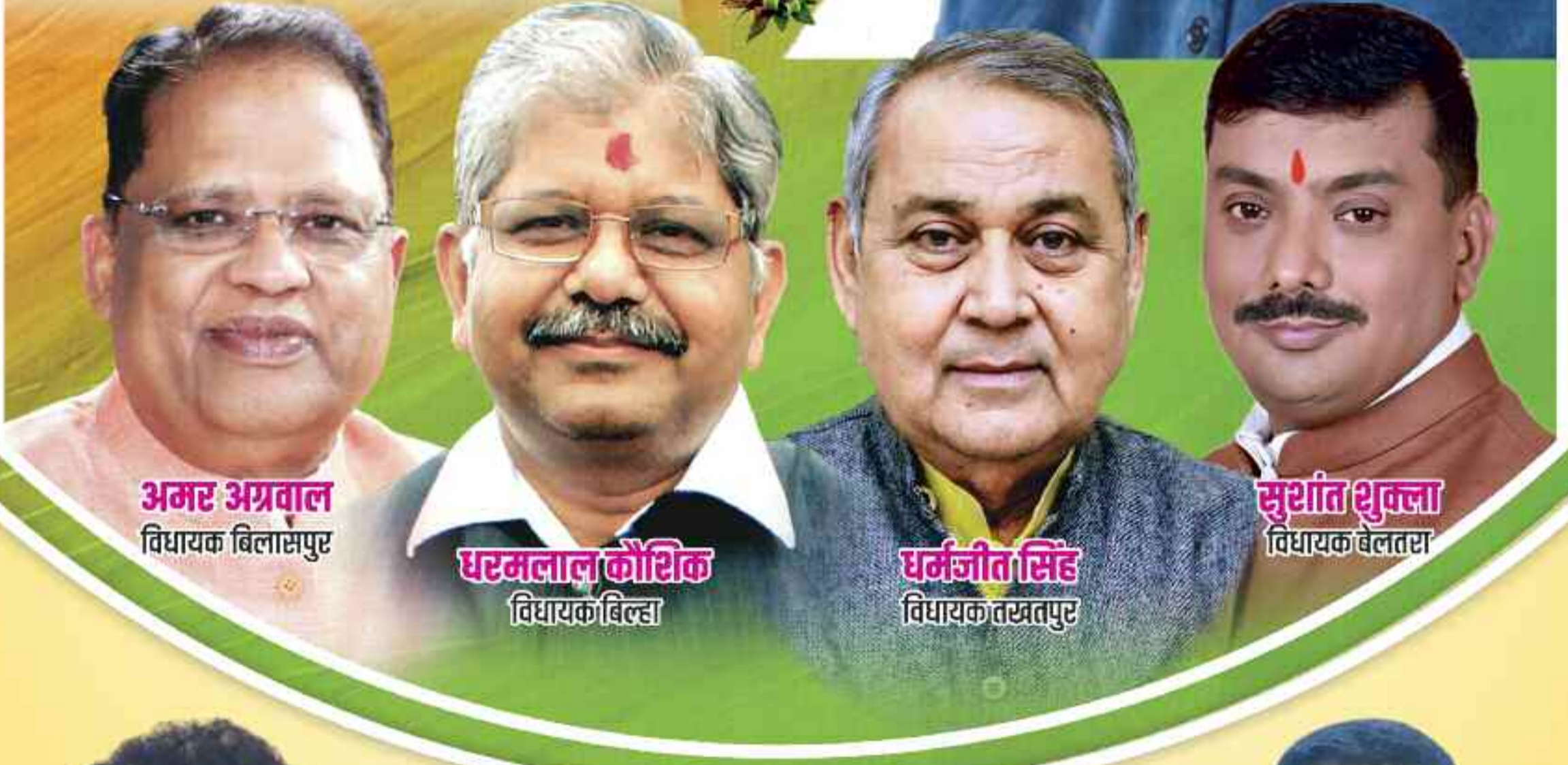
अमर अग्रवाल विधायक बिलासपुर