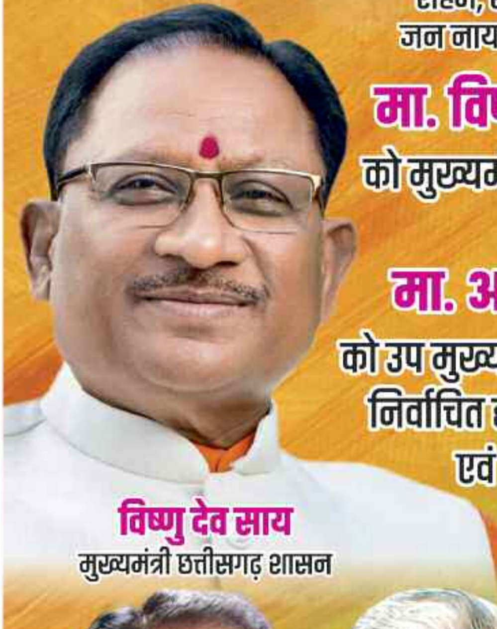
विष्णु देव साय मुख्यमंत्री छत्तीसगढ़ शासन

मा. अरुण साव जी को उप मुख्यमंत्री छत्तीसगढ़ शासन निर्वाचित होने पर हार्दिक बधाई एवं शुभकामनाएं